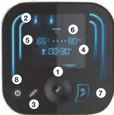
DUO7 80 LITROS