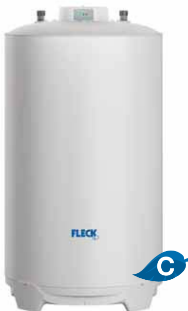
IF 120 LITROS